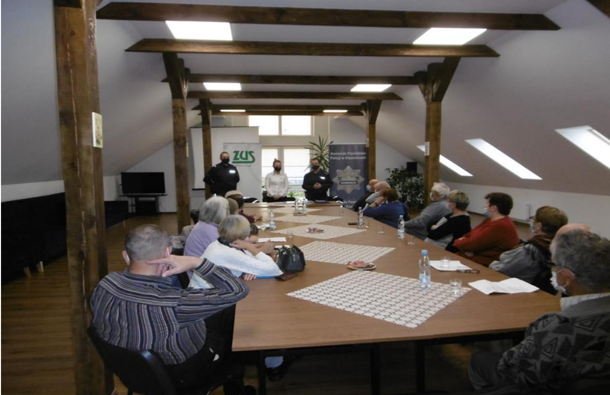
Spotkanie z przedstawicielami Policji i ZUS „Nie daj się oszustom” (27.10.2021 r.)