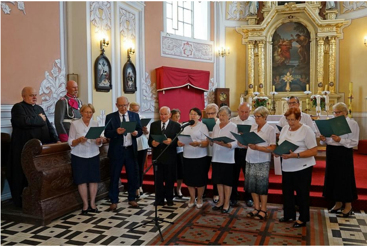
Występ seniorów w kościele w Oleksowie - 190 rocznica Bitwy pod Gniewoszowem (08.08.2021 r.)