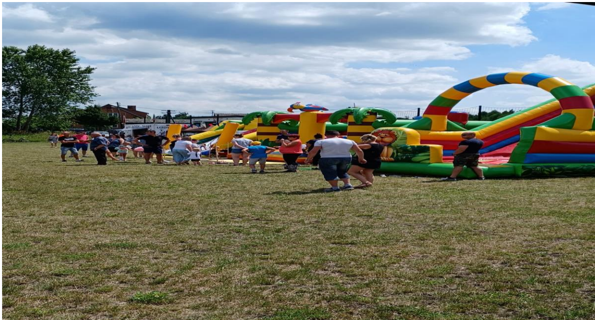
Festyn Rodzinny na rozpoczęcie wakacji w Sarnowie.