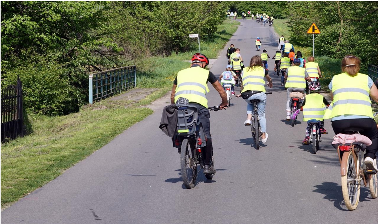
IV Gminny Rodzinny Rajd Rowerowy „Śladami rodzin Skłodowskich i Boguskich”