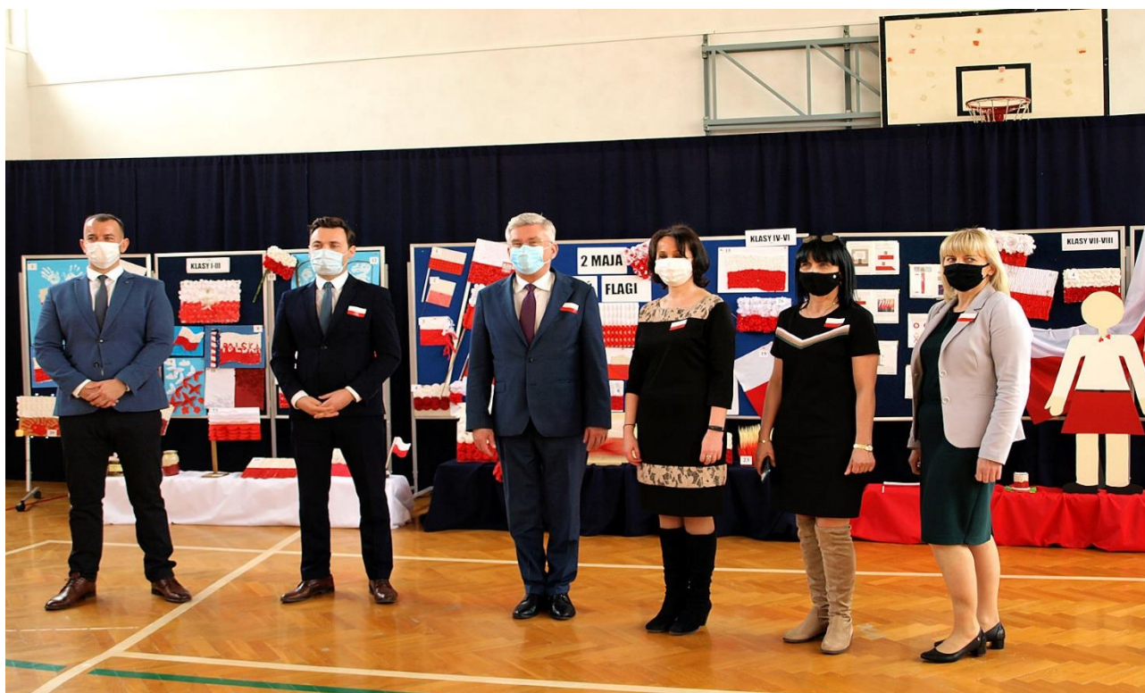
Spotkanie z Senatorem RP Stanisławem Karczewskim w Zespole Szkolno – Przedszkolnym w Gniewoszowie w ramach projektu „POLSKA FLAGA W KAŻDYM DOMU”,

Choć sytuacja epidemiczna niosła wiele ograniczeń, mimo tego udało nam się zrealizować dość dużo zaplanowanych imprez i sporo udało się zrobić w celu promocji gminy Gniewoszków.