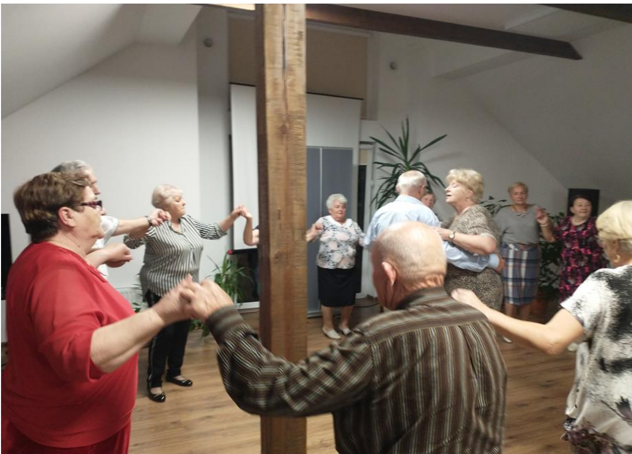
Wieczorek taneczny w Klubie Senior +