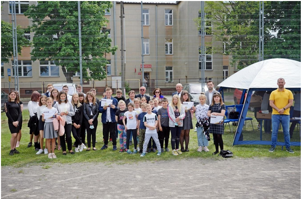
Obchody Międzynarodowego Dnia Dziecka w Gniewoszowie