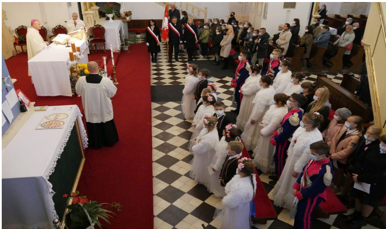
Uroczystość nadania Publicznej Szkole Podstawowej w Wysokim Kole imienia Marii Skłodowskiej – Curie.

W dniu 11 maja 2022r. Rada Gminy w Gniewoszowie podjęła Uchwałę Nr XXV/177/21 w sprawie nadania imienia Publicznej Szkole Podstawowej w Wysokim Kole. Na jej podstawie od 1 września 2022r. szkoła ta nosi imię słynnej polskiej noblistki Marii Skłodowskiej – Curie.