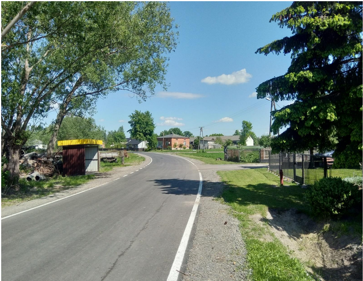
Przebudowa odcinka drogi w miejscowości Wólka Bachańska