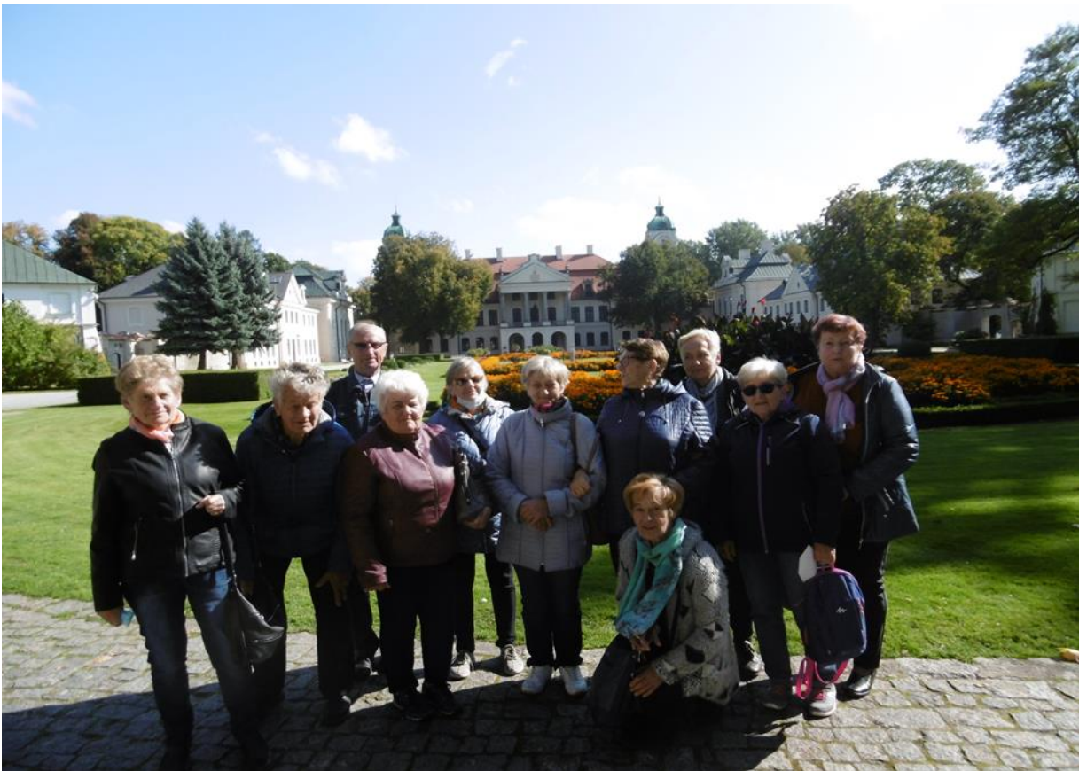
Wycieczka do Kozłówki (29.09.2021 r.)