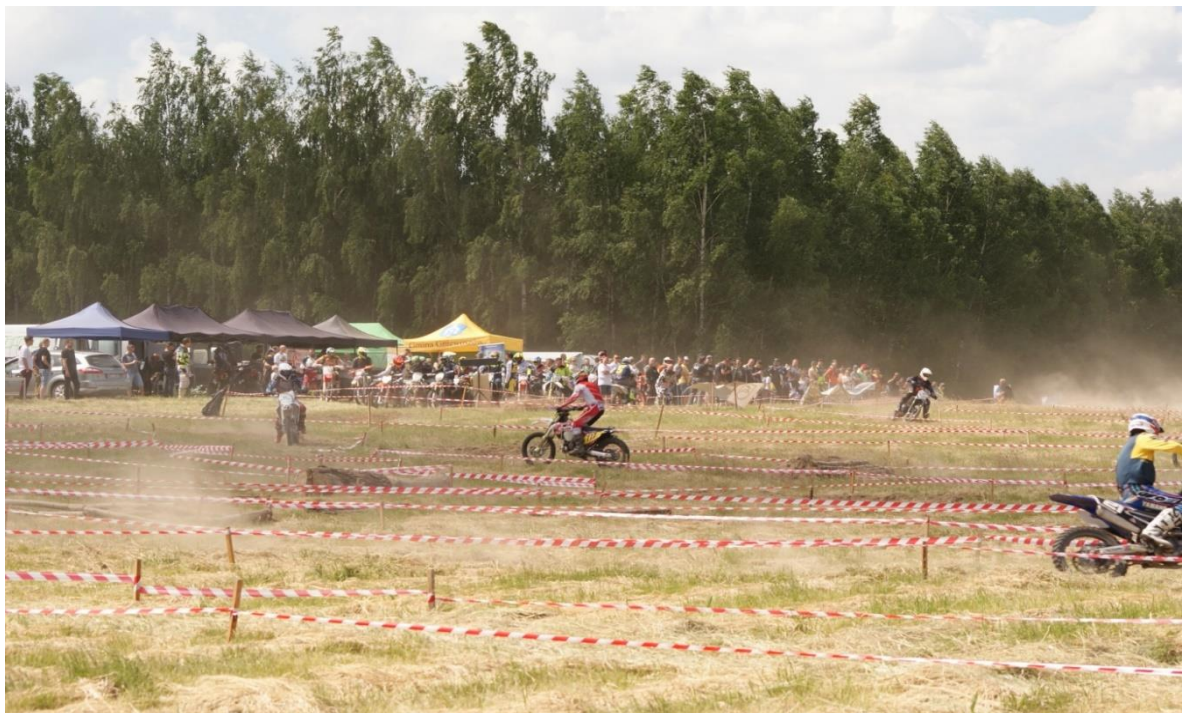
Zawody enduro – I Runda Mistrzostw Okręgu Warszawskiego w Supersprincie Enduro, którego organizatorem był KKM Kozienicki Klub Motorowy