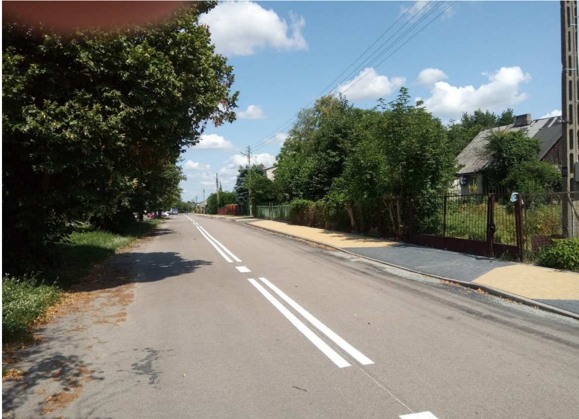
Przebudowa chodnika na ulicy Lubelskiej i Zielonej w miejscowości Gniewoszów