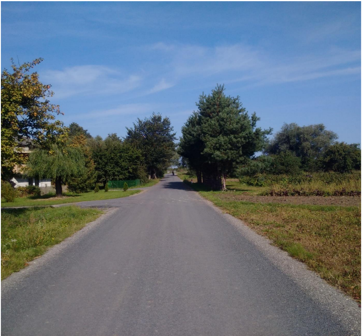
Przebudowa odcinka drogi w miejscowości Zwola