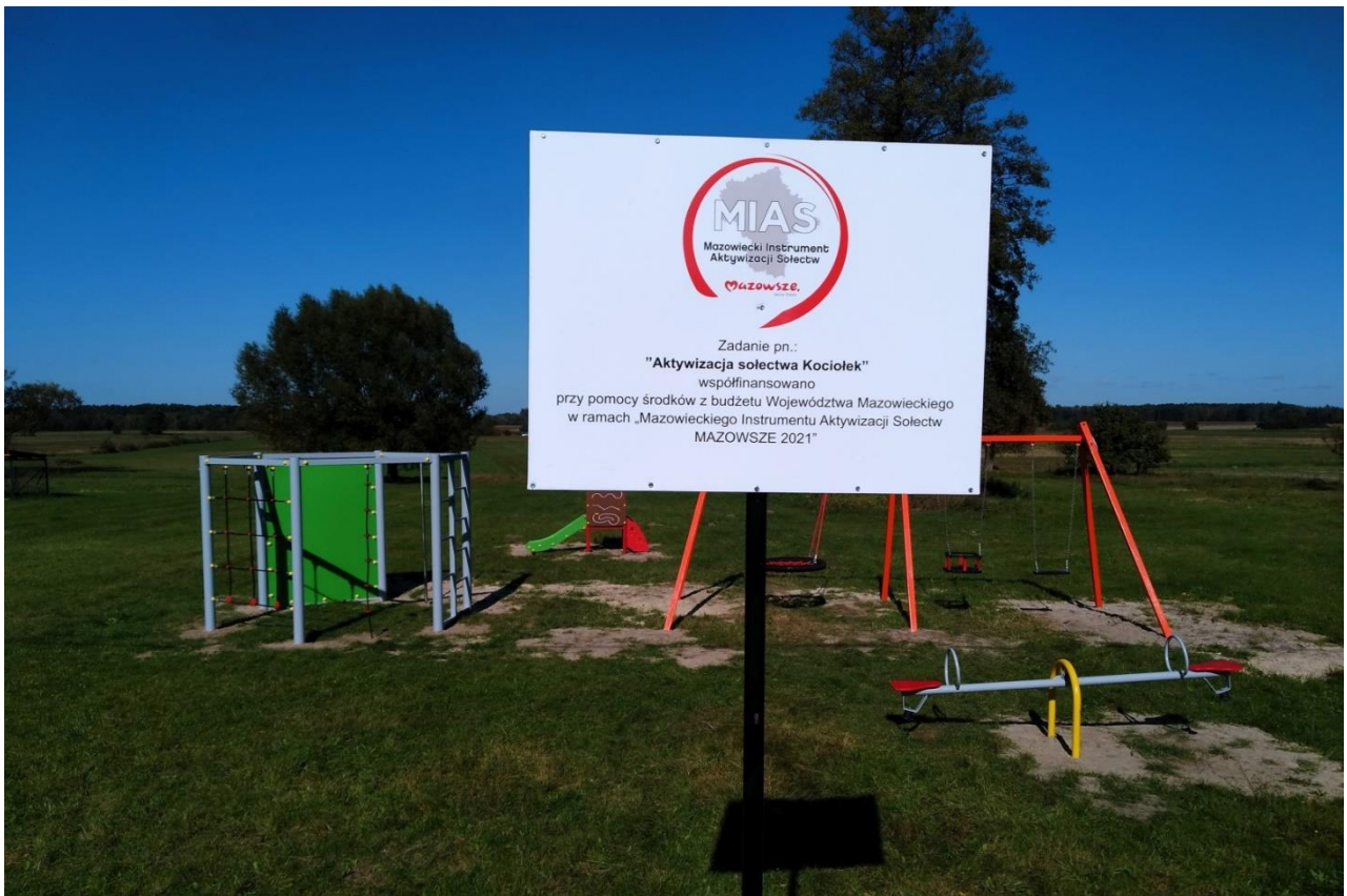
Zadanie pn. Aktywizacja sołectwa Kociołek