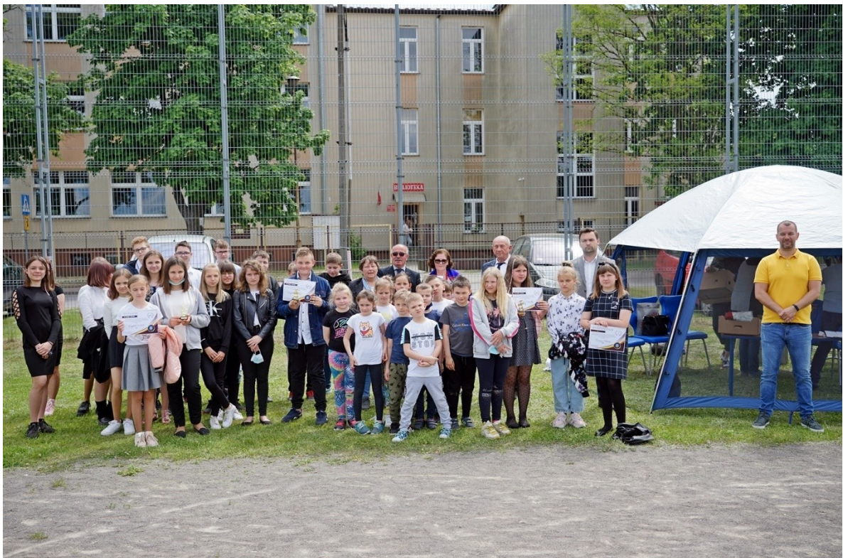
Obchody Międzynarodowego Dnia Dziecka w Gniewoszowie