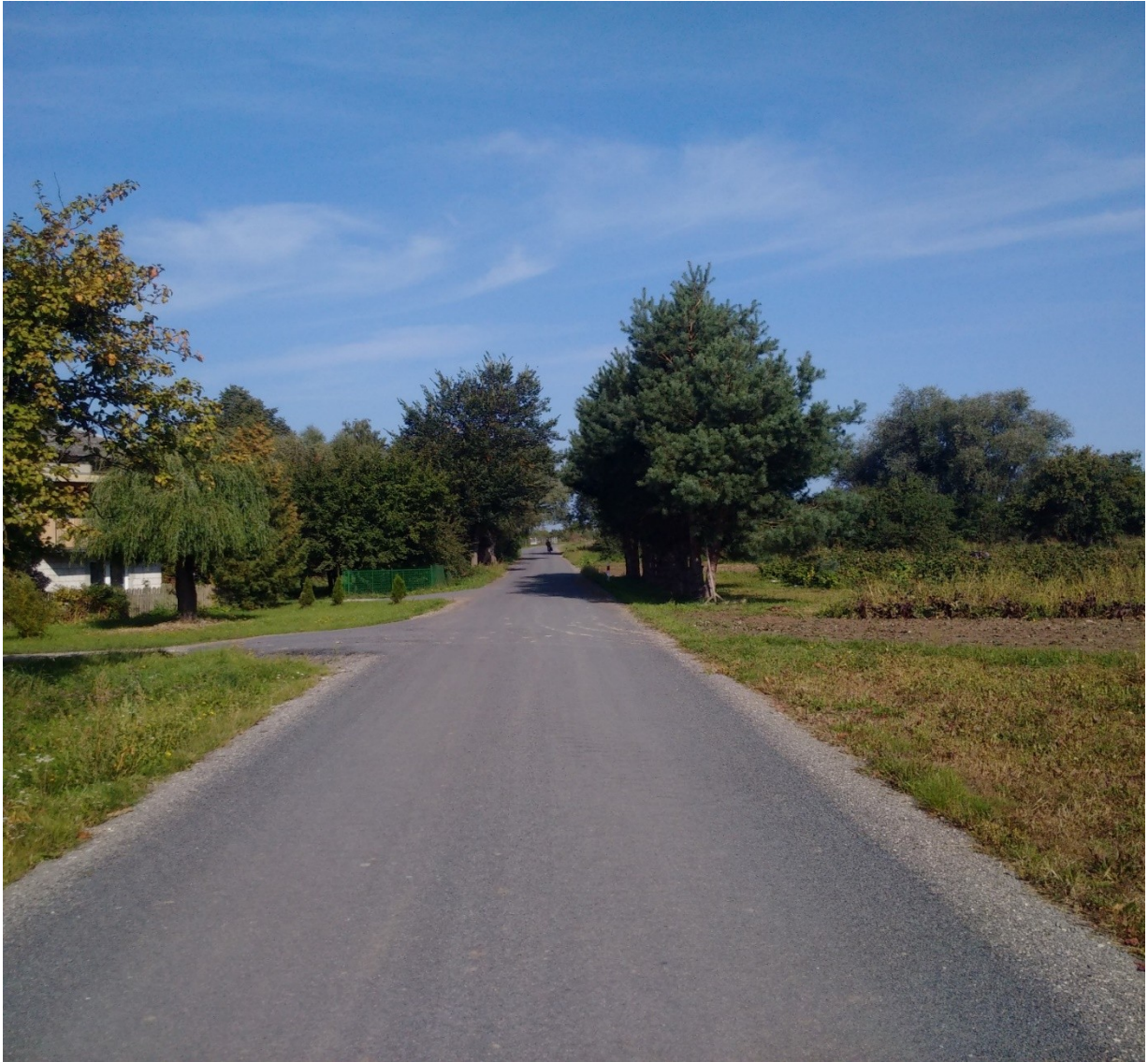
Przebudowa odcinka drogi w miejscowości Zwola