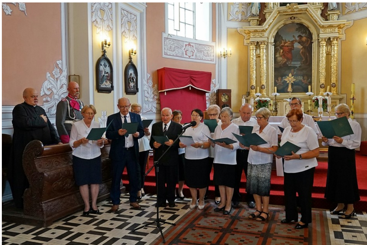
Występ seniorów w kościele w Oleksowie - 190 rocznica Bitwy pod Gniewoszowem (08.08.2021 r.)

W roku 2021 członkowie Klubu SENIOR+ wzięli udział w akcji zbierania nakrętek dla dzieci potrzebujących.