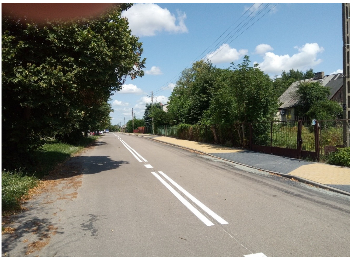
Przebudowa chodnika na ulicy Lubelskiej i Zielonej w miejscowości Gniewoszków

Przebudowę chodnika przy ul. Lubelskiej w Gniewoszkowie na długości 244 mb, w tym: rozbiórka starego chodnika z chodnikowych płyt betonowych, szerokość chodnika - 1,8 m, nawierzchnia chodnika z kostki betonowej wibroprasowanej.