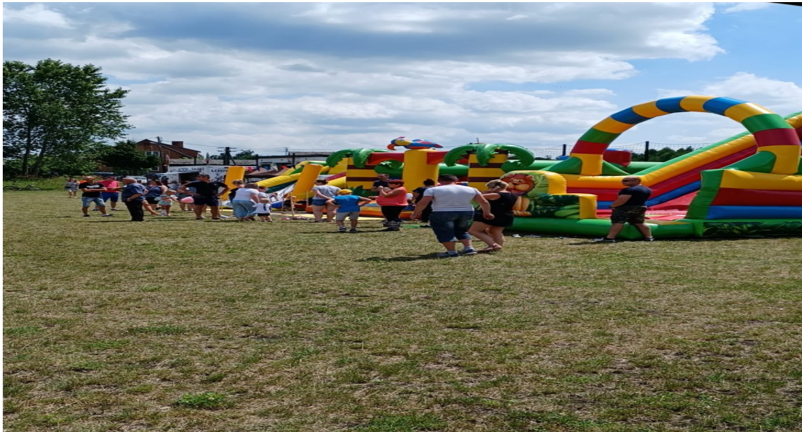
Festyn Rodzinny na rozpoczęcie wakacji w Sarnowie.