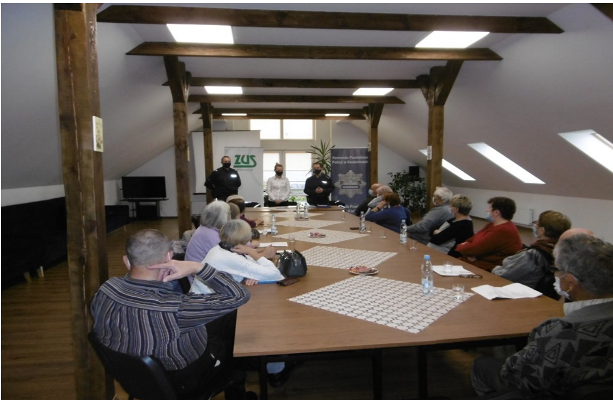
Spotkanie z przedstawicielami Policji i ZUS „Nie daj się oszustom” (27.10.2021 r.)