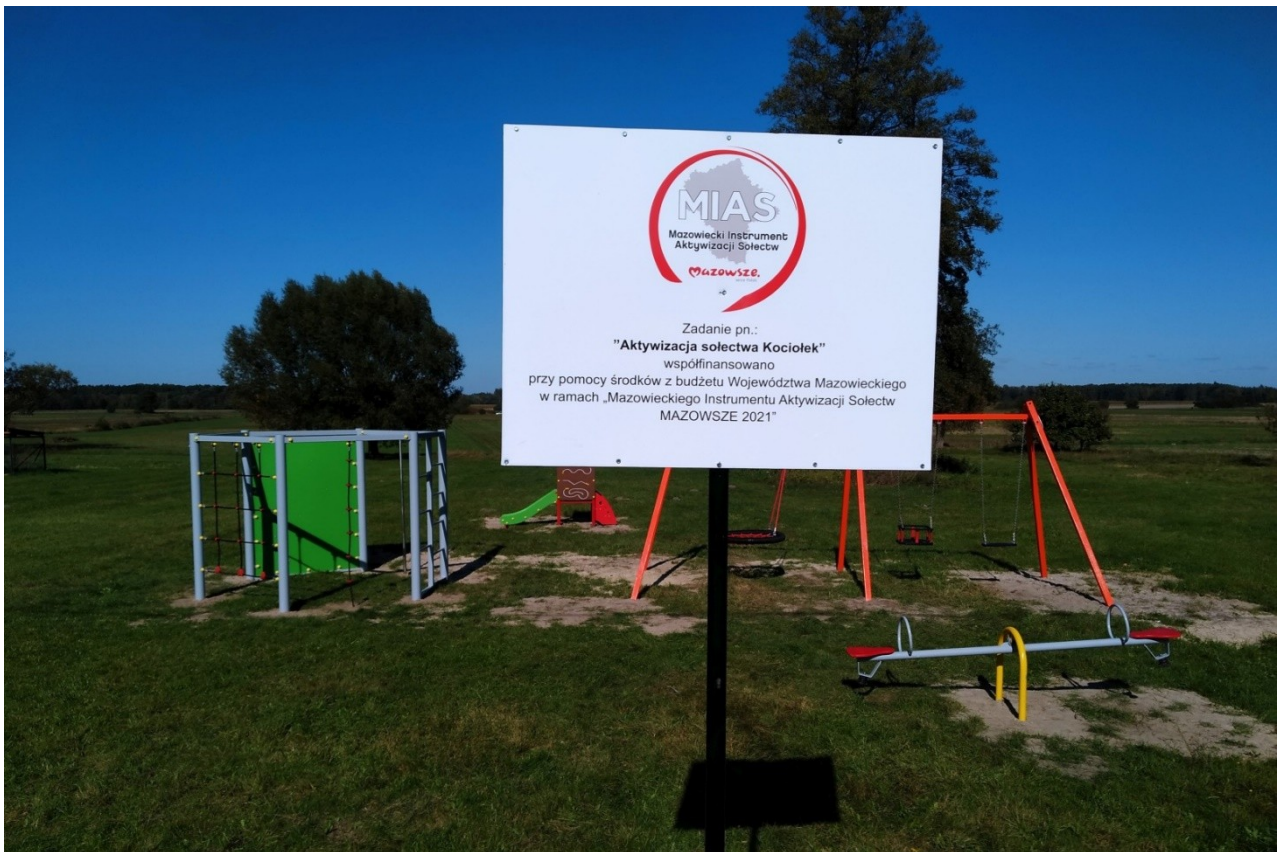
Zadanie pn. Aktywizacja sołectwa Kociołek