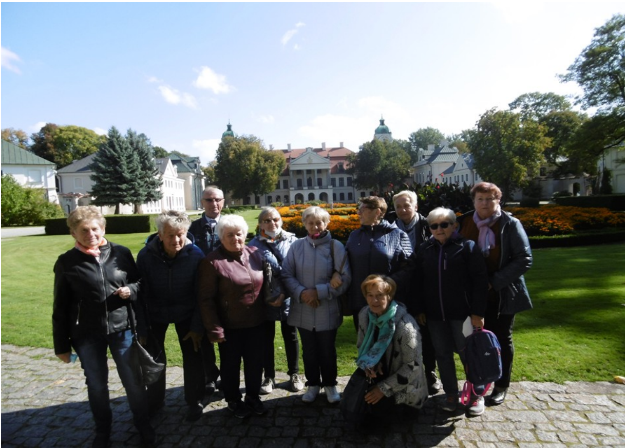
Wycieczka do Kozłówki (29.09.2021 r.)