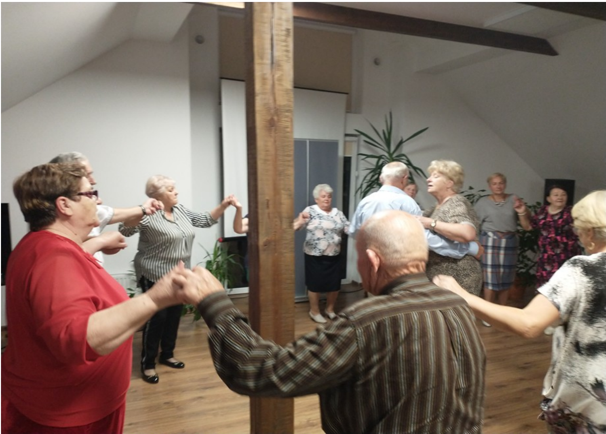
Wieczorek taneczny w Klubie Senior +