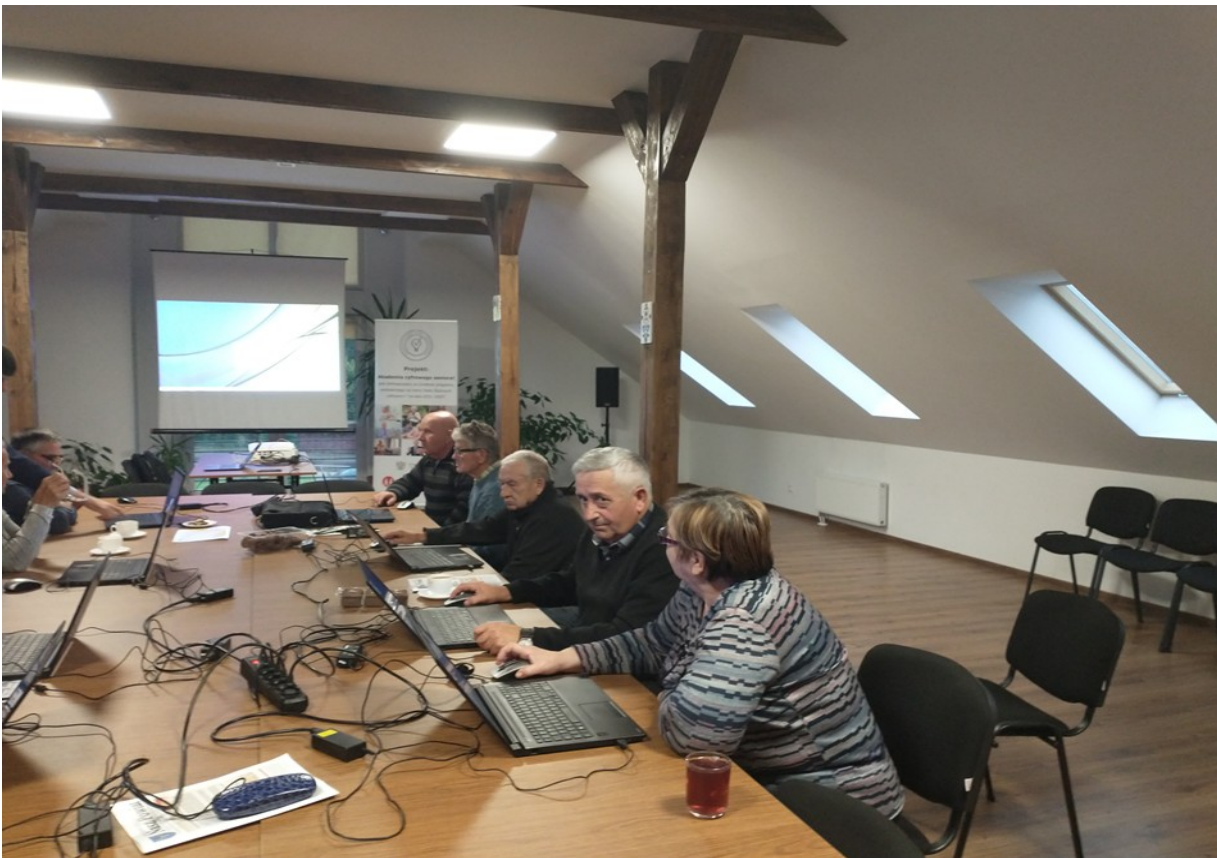
Udział seniorów w projekcie „Akademia cyfrowego seniora”