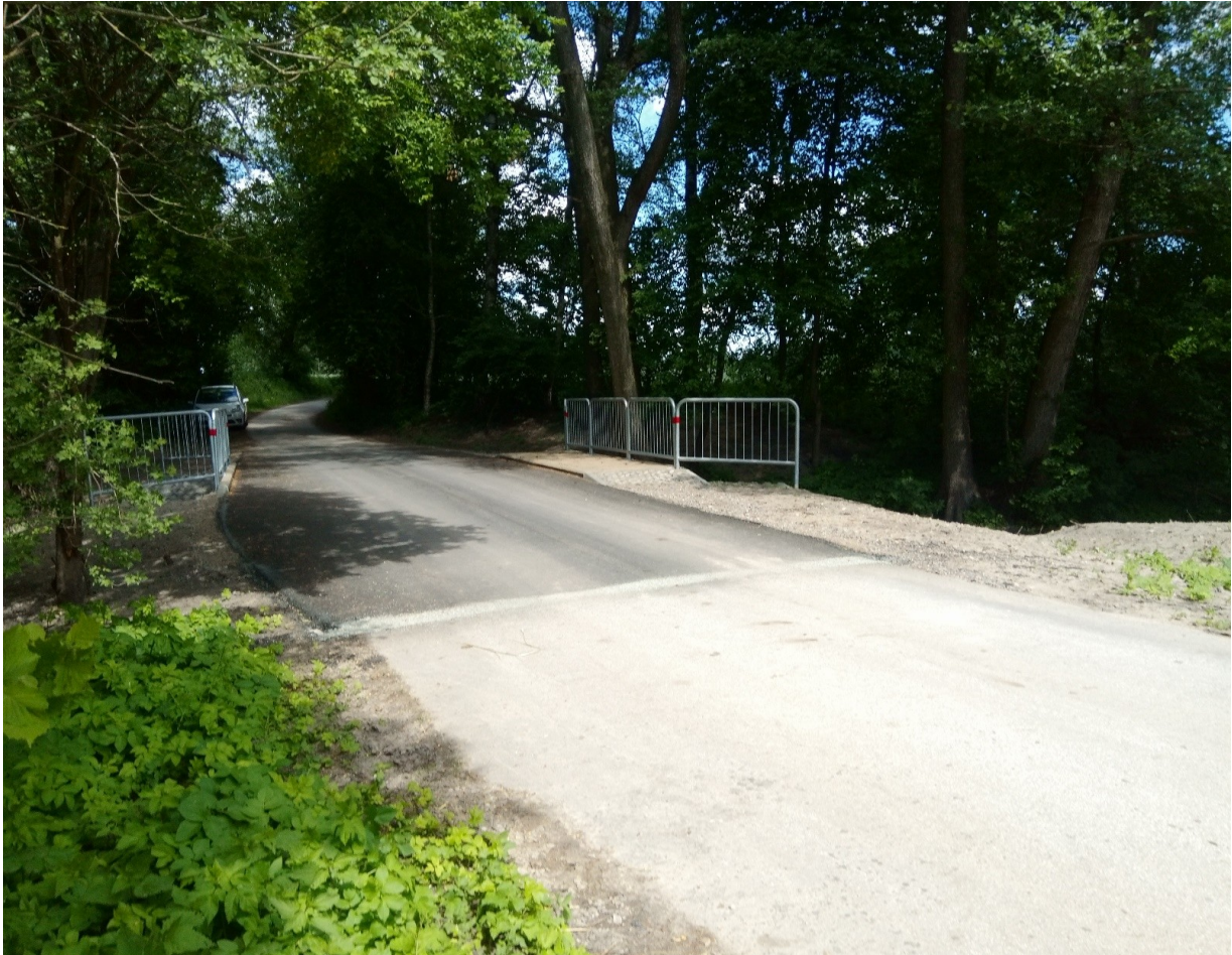
Modernizacja mostu na drodze w miejscowości Markowola