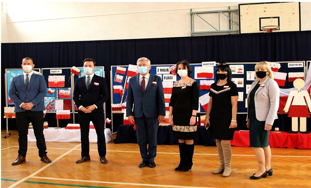
Spotkanie z Senatorem RP Stanisławem Karczewskim w Zespole Szkolno – Przedszkolnym w Gniewoszowie w ramach projektu „POLSKA FLA-GA W KAŻDYM DOMU”.