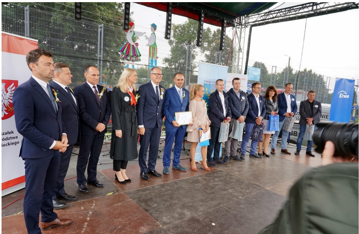
XVII Dożynki Powiatu Kozienickiego Gniewoszków 2021