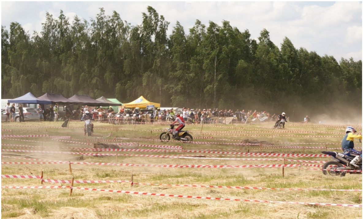
Zawody enduro – I Runda Mistrzostw Okręgu Warszawskiego w Supersprincie Enduro, którego organizatorem był KKM Kozienicki Klub Motorowy