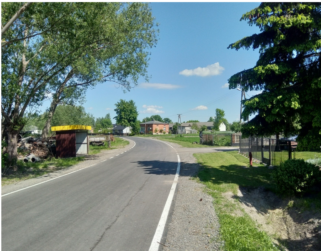
Przebudowa odcinka drogi w miejscowości Wólka Bachańska