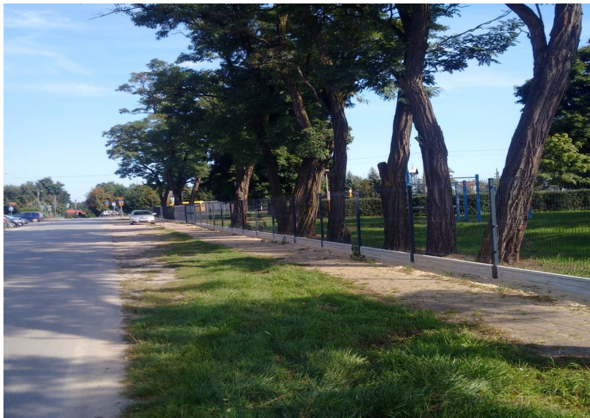
Budowa ogrodzenia przy Szkole Podstawowej w Wysokim Kole

ocynkowane i malowane, podmurówka, montaż bramy z furtką, bramy bez furtki, furtki – 1 szt., kolor ogrodzenia: szary/grafitowy.