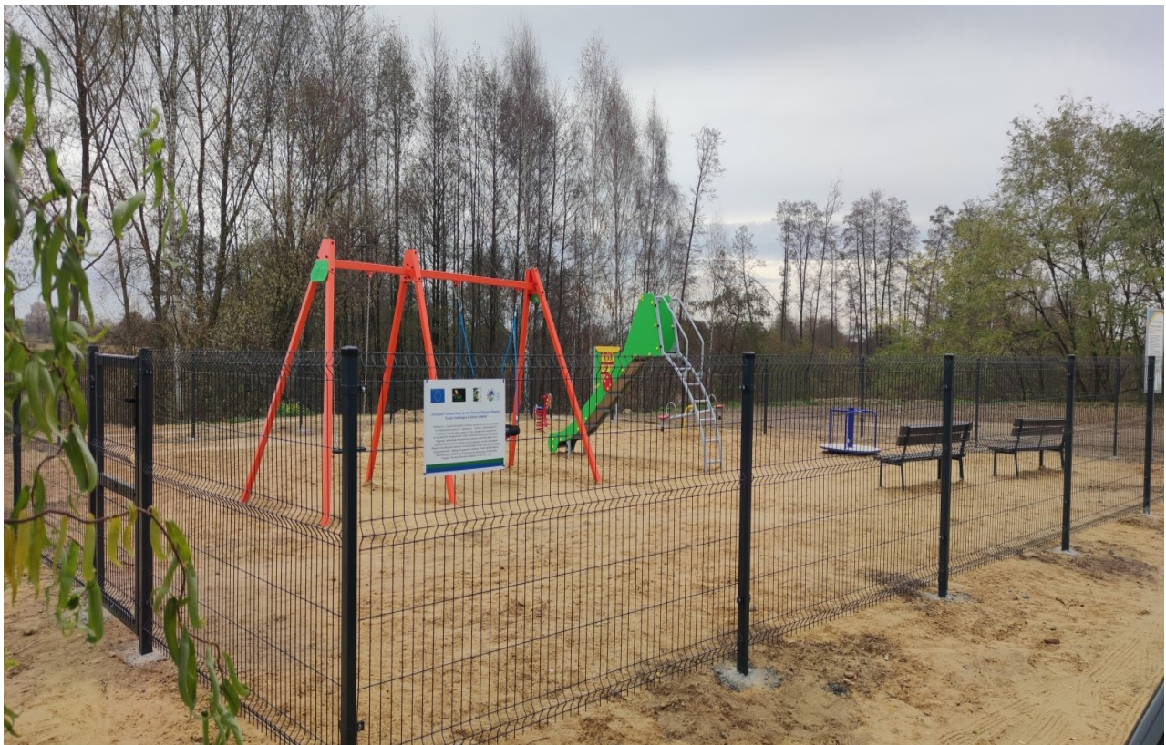
„Zagospodarowanie przestrzeni publicznej poprzez wyposażenie w infrastrukturę turystyczno – rekreacyjną”