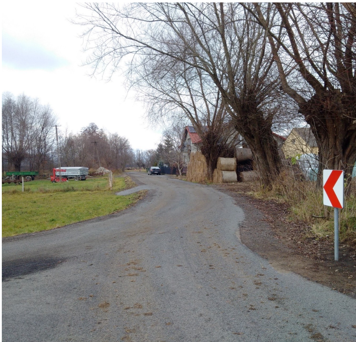
Przebudowa odcinka drogi w miejscowości Oleksów od km 0+000 do km 0+425, w ramach zadania budżetowego: Przebudowa odcinka drogi w miejscowości Oleksów „Gruszka”