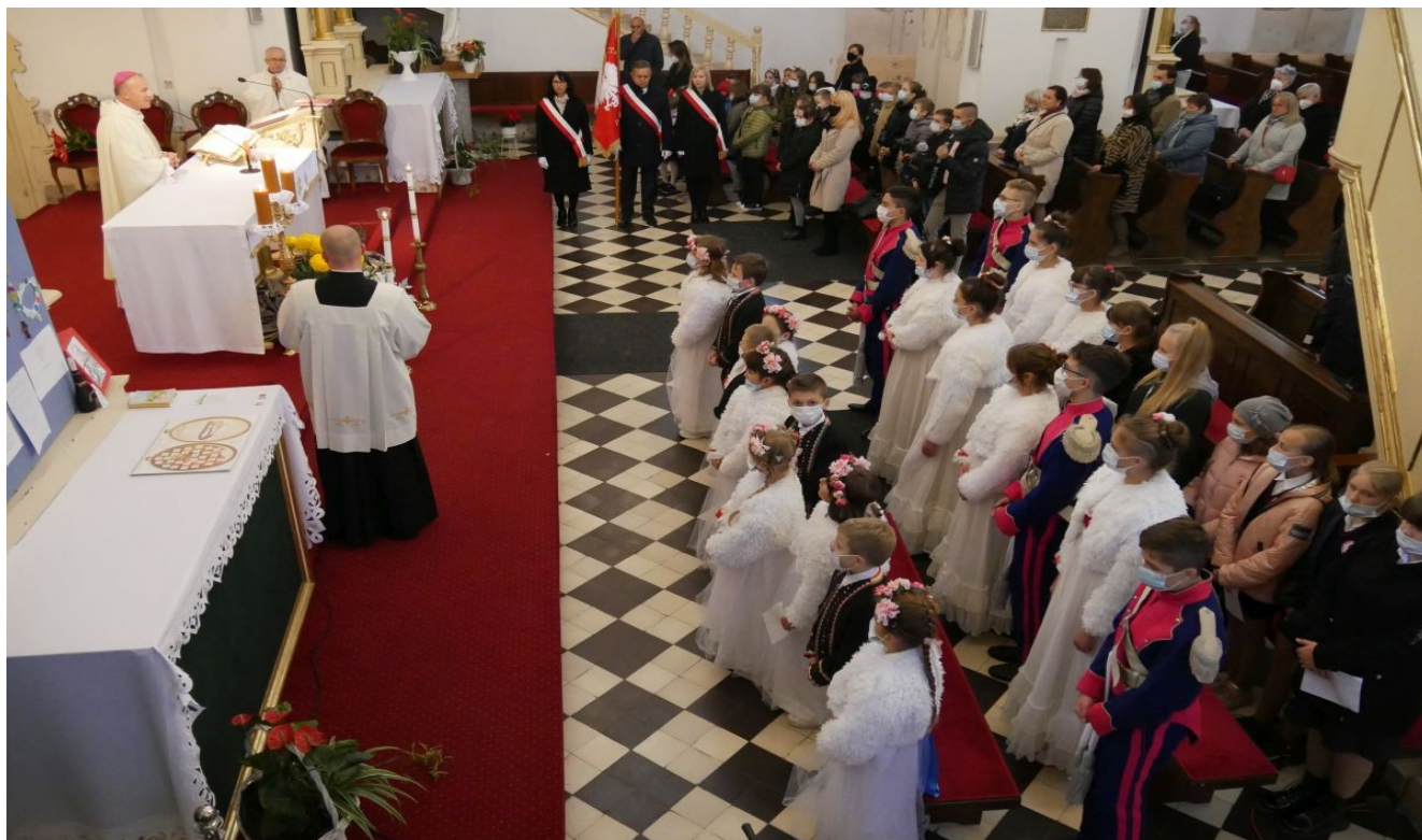
Uroczystość nadania Publicznej Szkole Podstawowej w Wysokim Kole imienia Marii Skłodowskiej – Curie.

W dniu 11 maja 2021r. Rada Gminy w Gniewoszowie podjęła Uchwałę Nr XXV/177/21 w sprawie nadania imienia Publicznej Szkole Podstawowej w Wysokim Kole. Na jej podstawie od 1 września 2021r. szkoła ta nosi imię słynnej polskiej noblistki Marii Skłodowskiej – Curie.