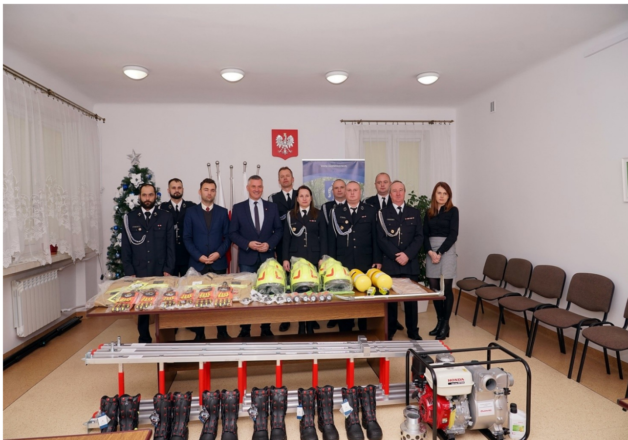
Oficjalne przekazanie zakupionego dzięki wsparciu Samorządu Województwa Mazowieckiego sprzętu jednostkom OSP z terenu Gminy Gniewoszków

Na utrzymanie działalności przeciwpożarowej w 2021 roku Gmina Gniewoszków wydatkowała łącznie 313 241,85 zł, w tym wydatki inwestycyjne w wysokości 72 754,90 zł oraz wydatki bieżące w kwocie 240 486,95 zł, z przeznaczeniem m.in. na wykonanie instalacji ogrzewania gazowego w budynku strażnicy OSP Wysokie Koło oraz wykonanie instalacji fotowoltaicznej na budynku strażnicy OSP Sarnów, a także na zakup sprzętu, wyposażenia i umundurowania strażackiego, zakup mediów, paliwa do samochodów pożarniczych i sprzętu silnikowego, umowy zlecenia z konserwatorami, ekwiwalent pieniężny za udział w działaniach ratowniczych i szkoleniach pożarniczych, bieżące remonty strażnic, naprawę samochodów, badania techniczne i ubezpieczenia pojazdów, badania i ubezpieczenie strażaków oraz inne wydatki mające wpływ na utrzymanie gotowości bojowej jednostek OSP.