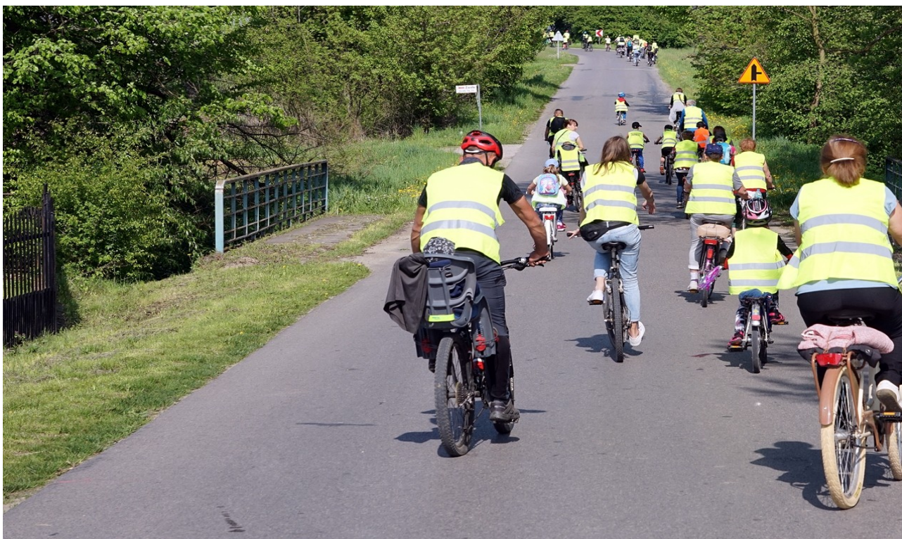
IV Gminny Rodzinny Rajd Rowerowy „Śladami rodzin Skłodowskich i Boguskich”