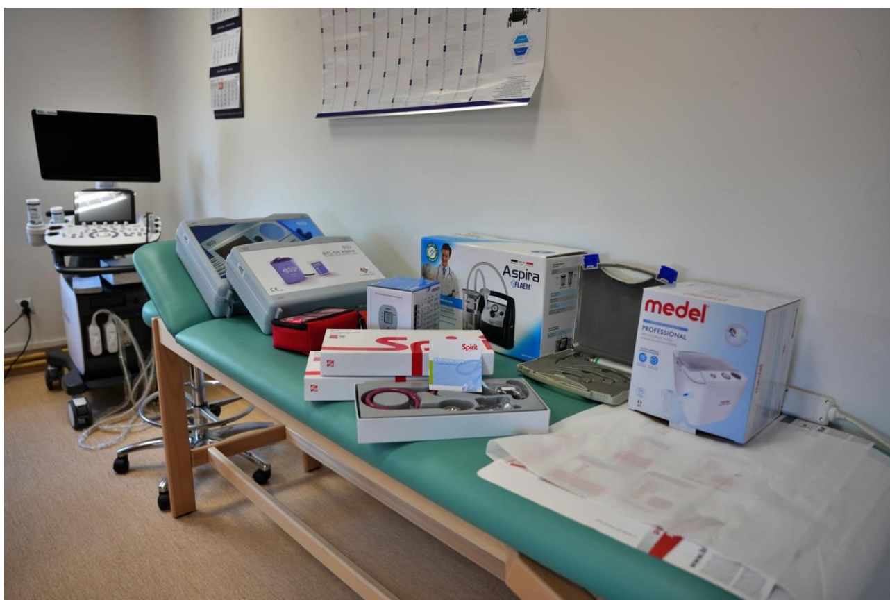
Zakupiony sprzęt medyczny dla SPZOZ w Gniewoszowie.

Zakupiono następujące wyposażenie: aparat USG, holter ciśnieniowy krwi, autoklaw, EKG, ampularium, ssak, ciśnieniomierz, aparat ambu, wagę dziecięcą, stół do pielęgnacji niemowląt typ SPTM, stacjonarny stół rehabilitacyjny RELAX, inhalator, spirometr, fotel, wózek zabiegowy, stół rehabilitacyjny, wagę, lampę bakteriobójczą.