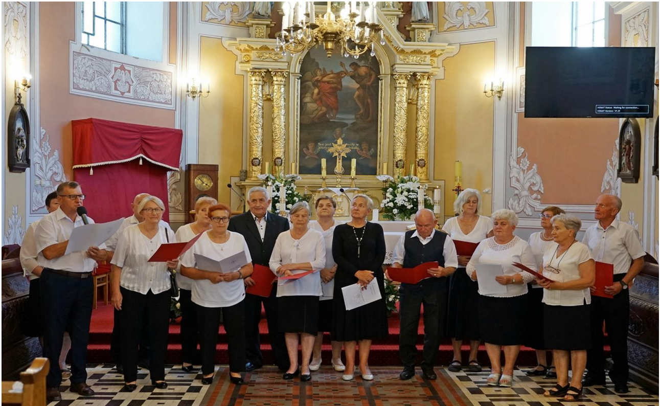
Uroczystość upamiętniająca 191 rocznicę Bitwy pod Gniewoszowem.