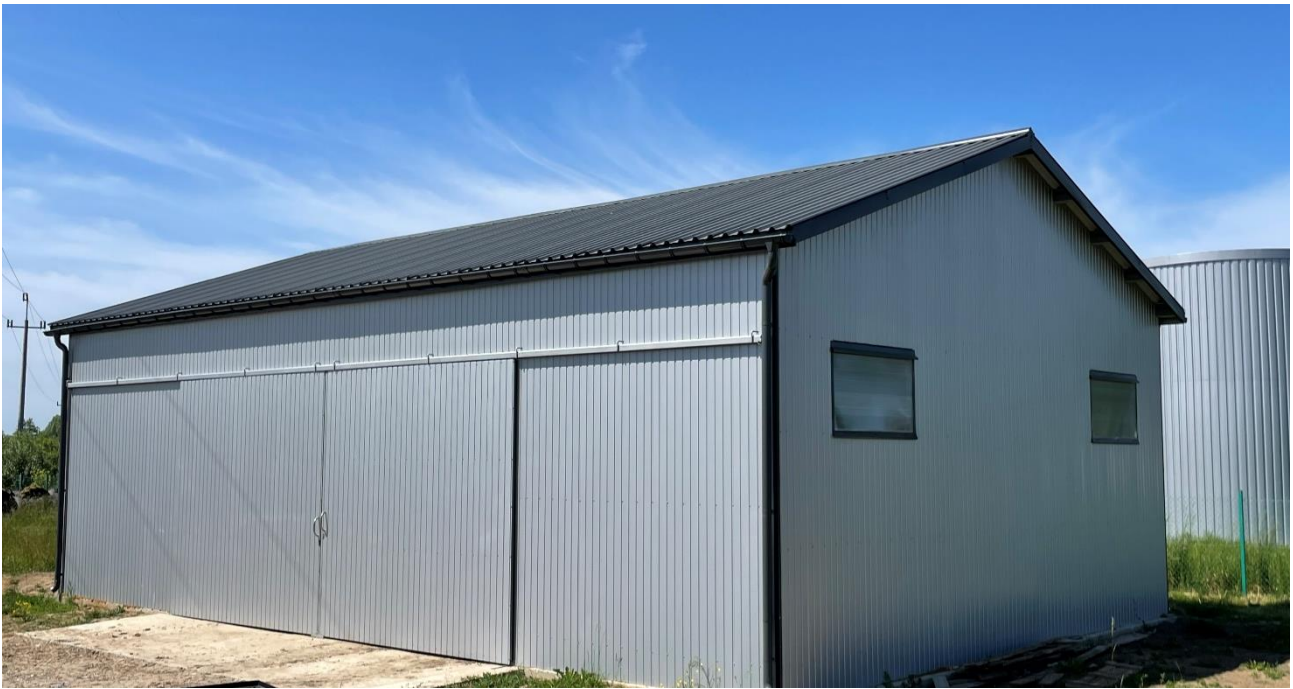
Budynek magazynowy w Oleksowie