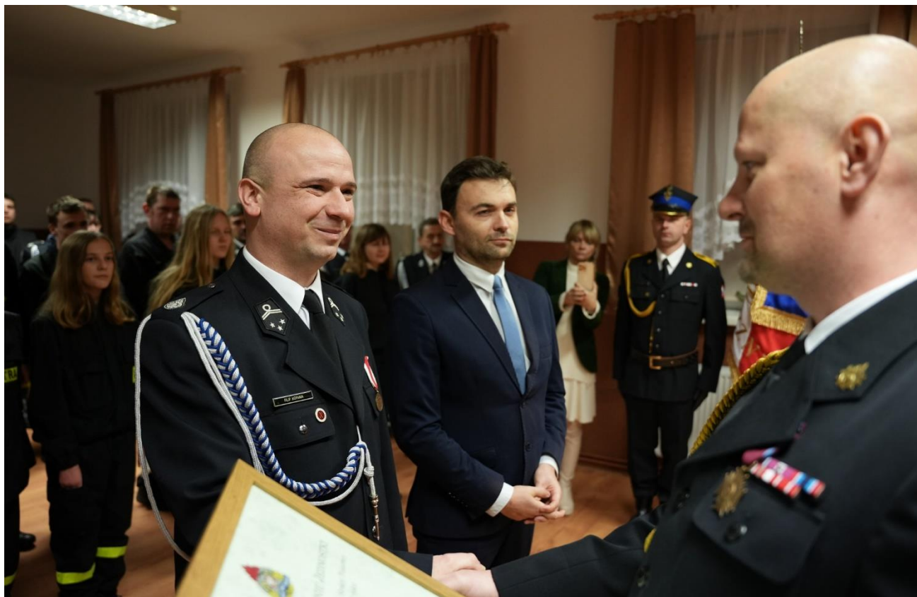
Uroczystość z okazji jubileuszu 95-lecia Ochotniczej Straży Pożarnej w Wysokim Kole oraz wstąpienia jednostki do Krajowego Systemu Ratowniczo – Gaśniczego – 16.12.2022 r.