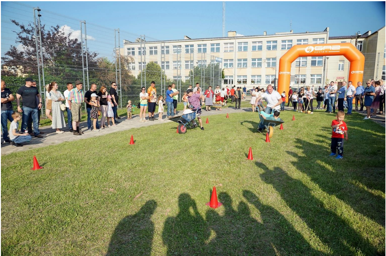
Festyn Rodzinny z okazji Dnia Dziecka i Spartakiada Solectw.