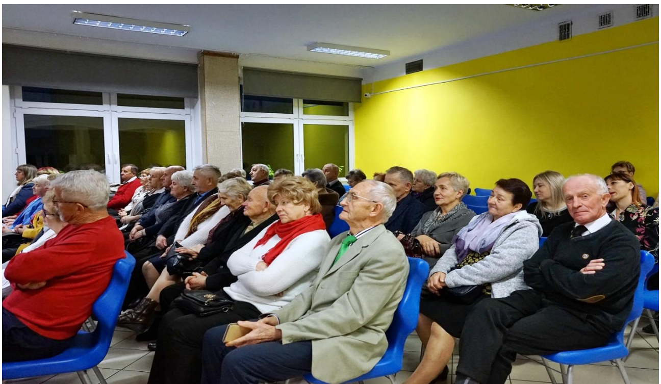
Gminny Dzień Seniora 14.11.2022r.