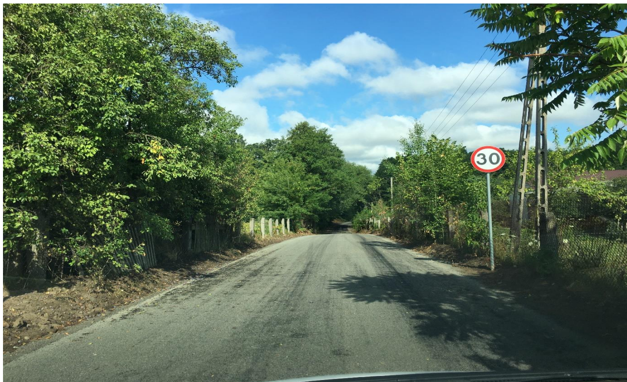
Przebudowa odcinka drogi w miejscowości Sarnów "Tartak".