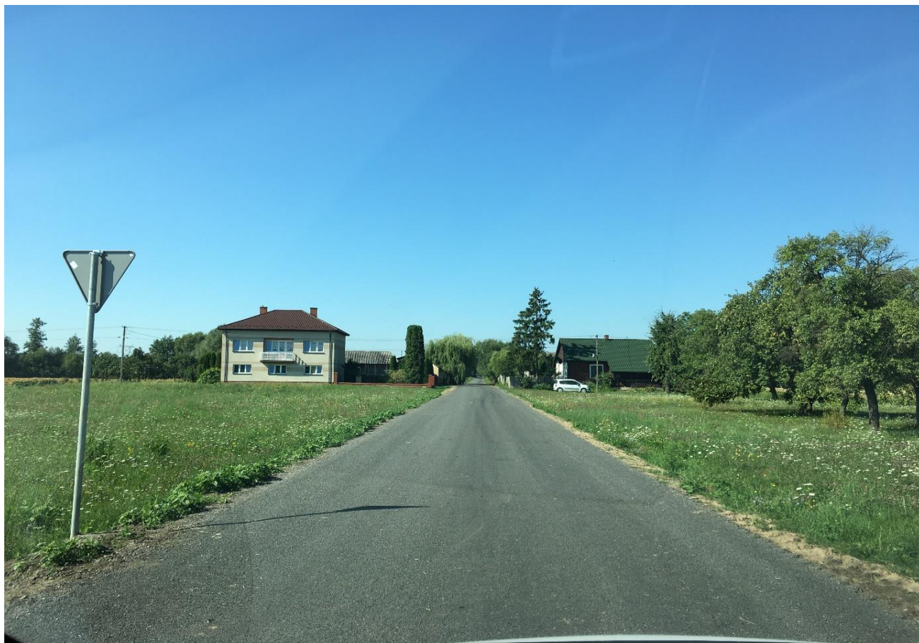
Przebudowa odcinka drogi w m. Sławczyn.

„Przebudowa odcinka drogi gminnej nr relacji Sarnów Wólka Bachańska”. Cena brutto: 903 957,75 zł.