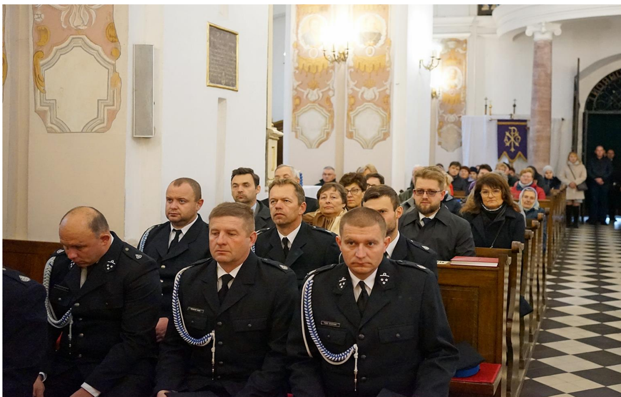
Uroczyste obchody święta Niepodległości w Wysokim Kole 11.11.2022r.

Promocję Gminy Gniewoszków staramy się prowadzić wielokierunkowo, by po podsumowaniu i przeanalizowaniu ilości uczestników obecnych na imprezach i wydarzeniach wybrać główne kierunki. Być może będą to: szlak zagród edukacyjnych, centrum pamięci poświęcone Marii Skłodowskiej - Curie czy rajd rowerowy nieoznakowanym szlakiem tablic pt. „Śladami rodzin Skłodowskich i Boguskich”. W chwili obecnej w naszej gminie skupiamy się na wydarzeniach cyklicznych.