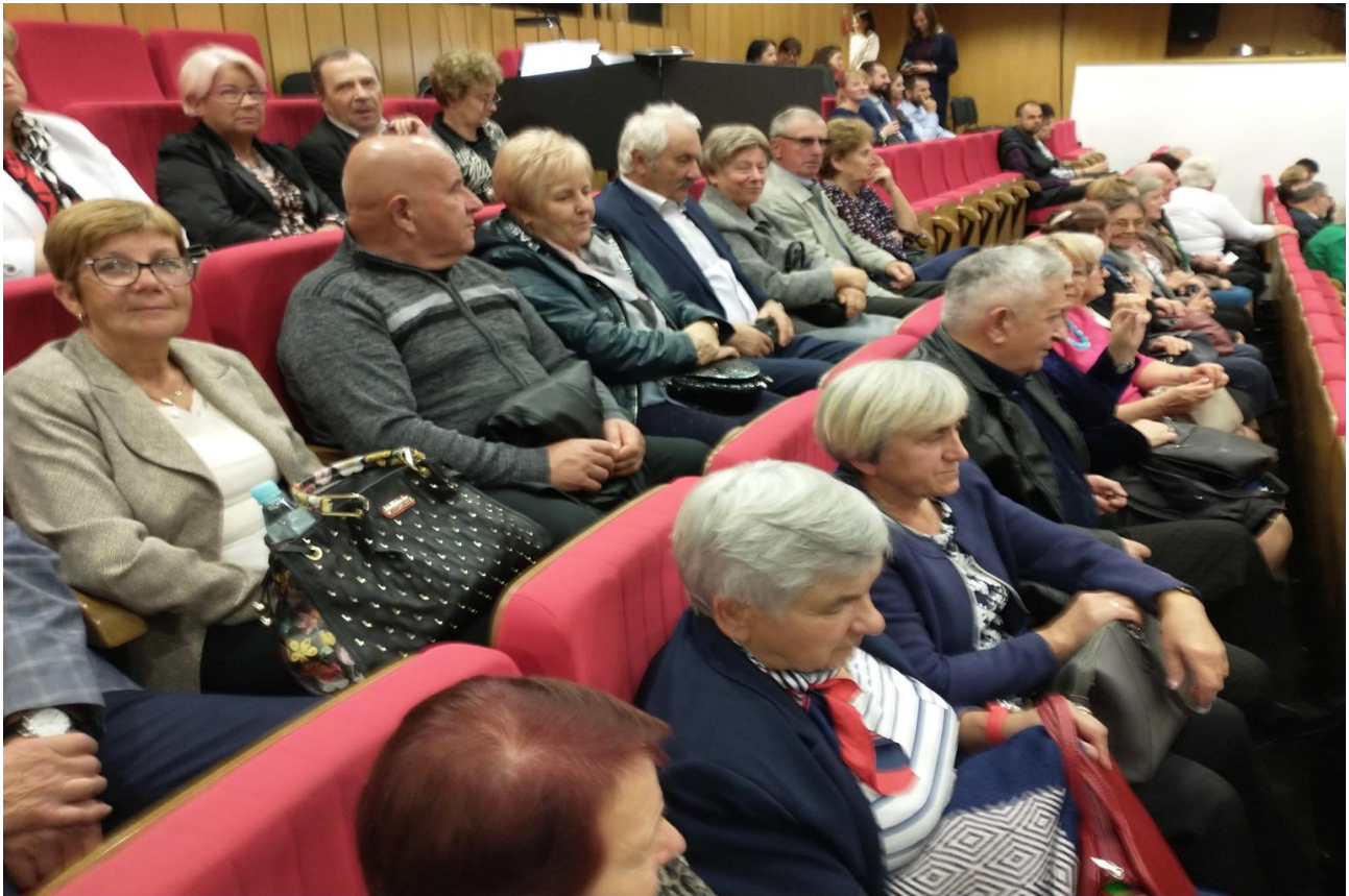
W Teatrze Muzycznym w Lublinie – „Zemsta nietoperza”.