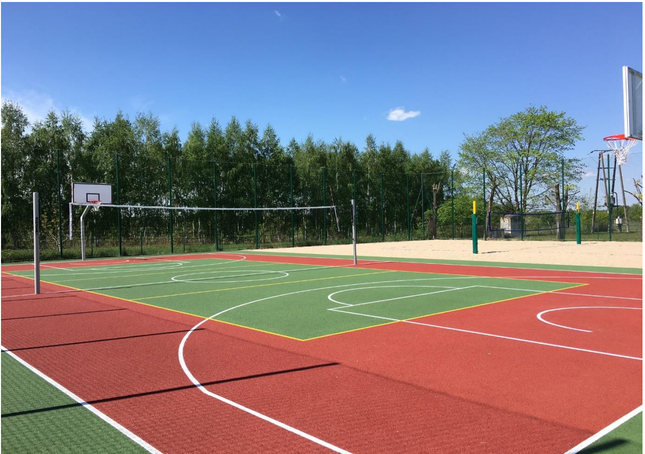
Boisko wielofunkcyjne w Gniewoszowie