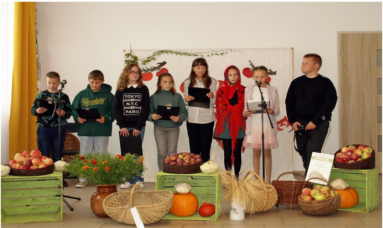
Festyn rodzinny „OWOCOBranie” w Borku.