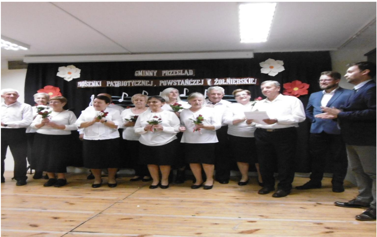
VI Przegląd Piosenki Patriotycznej, Powstańczej i Żołnierskiej – 4.11.2022 r.