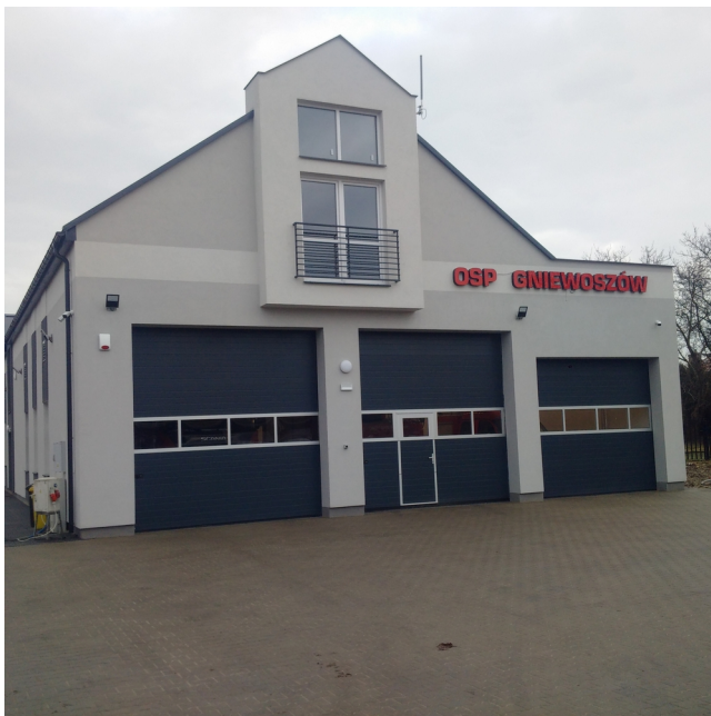
Częściowa rozbiórka, przebudowa i rozbudowa budynku Ochotniczej Straży Pożarnej w Gniewoszowie.