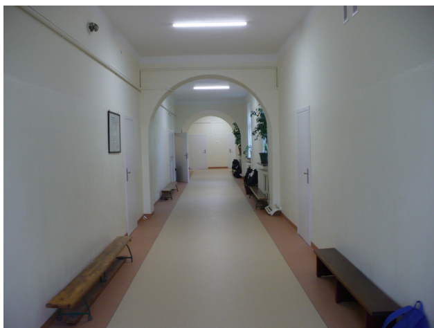
Remont korytarzy, sal, toalet w Publicznej Szkole Podstawowej w Wysokim Kole