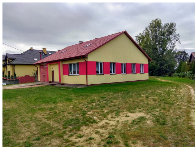
Remont budynku Ochotniczej Straży Pożarnej Wysokie Koło w zakresie dachu