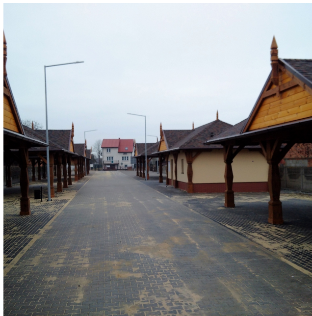
„Przebudowa targowiska w Gniewoszowie”