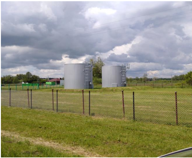
Budowa dwóch zbiorników na wodę pitną, na działce nr ewid. 657, położonej w miejscowości Oleksów