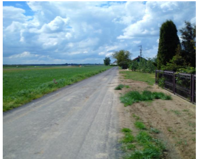
Przebudowa drogi Regów Stary-Borek