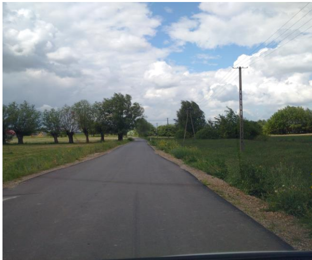
Przebudowa drogi Zwola-Sarnów „Prusiny”