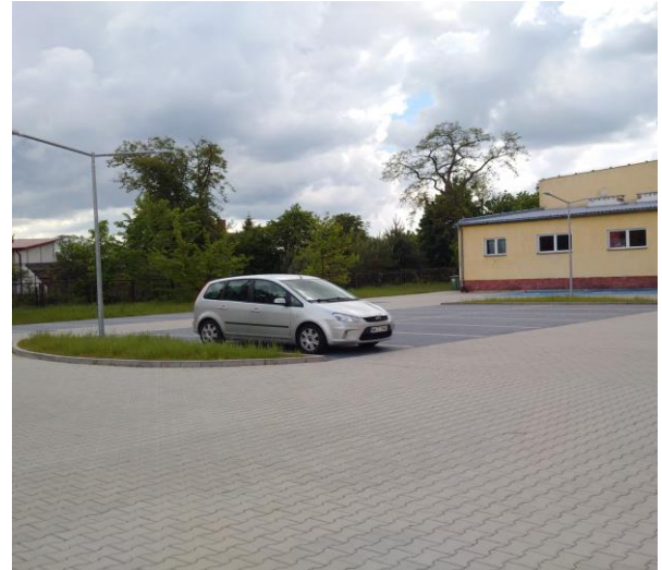
Zagospodarowanie przestrzeni wokół Zespołu Szkolno-Przedszkolnego w Gniewoszowie - „Budowa parkingu naziemnego z odcinkiem doziemnej instalacji elektrycznej”