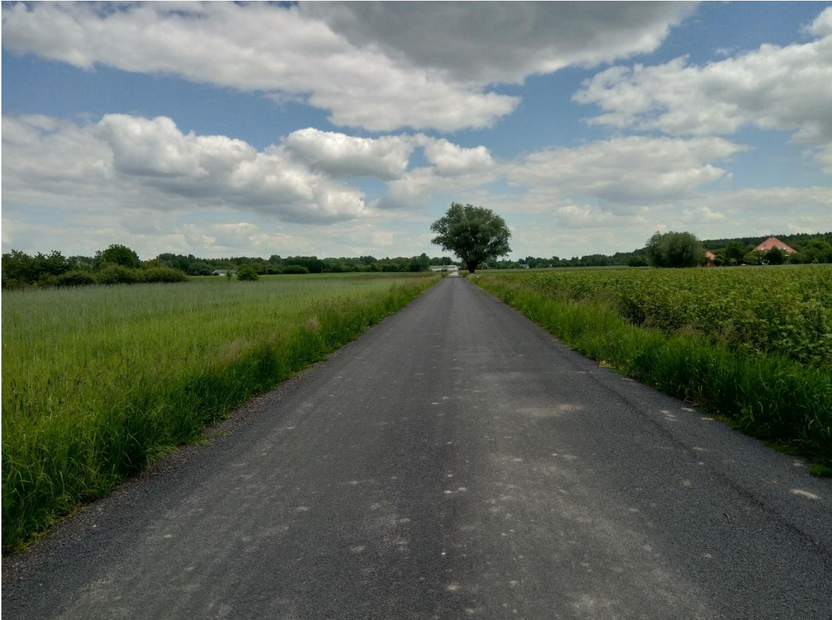
Przebudowa odcinka drogi w m. Wysokie Koło „Powiśle”