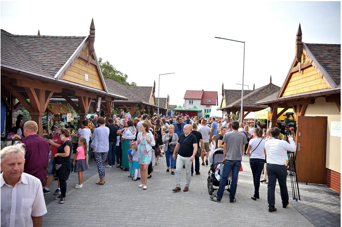
I Przegląd Kół Gospodyń Wiejskich