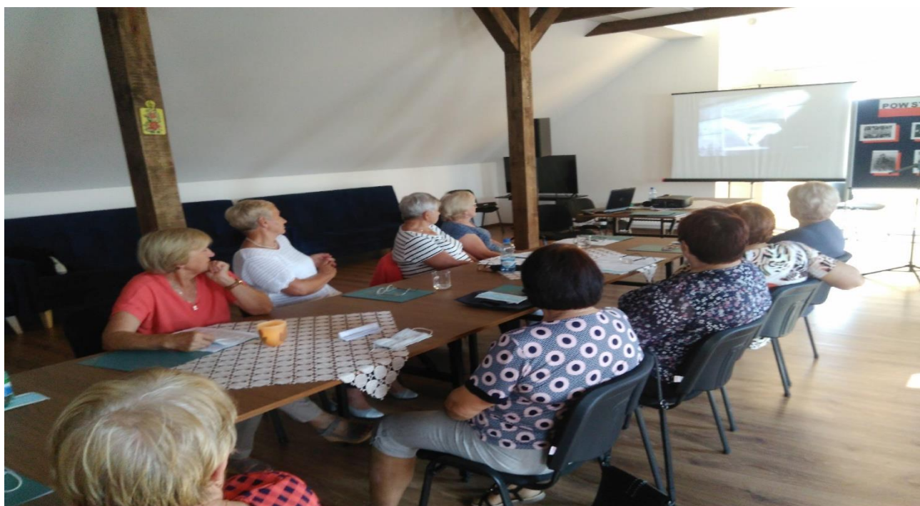
Wieczornica upamiętniająca Powstanie Warszawskie 29.07.2020 r.