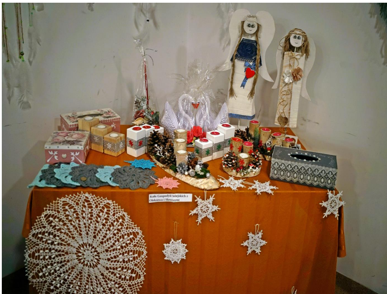
IV Wystawa Twórców Ziemi Gniewoszkowskiej.

Łącznie w imprezach promujących gminę Gniewoszków w 2020 roku wzięło udział 1075 osób.