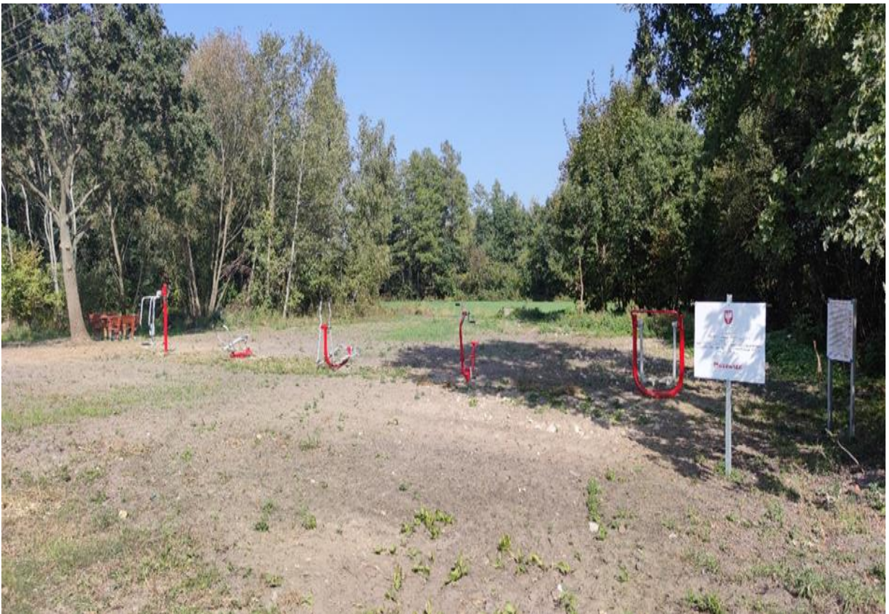
Zadanie „Aktywizacja sołectwa Wólka Bachańska