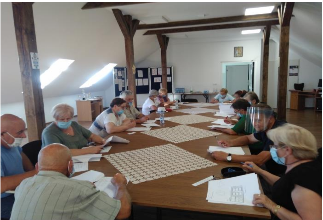
Wspólne ćwiczenie umysłu i koncentracji 01.07.2020 r.