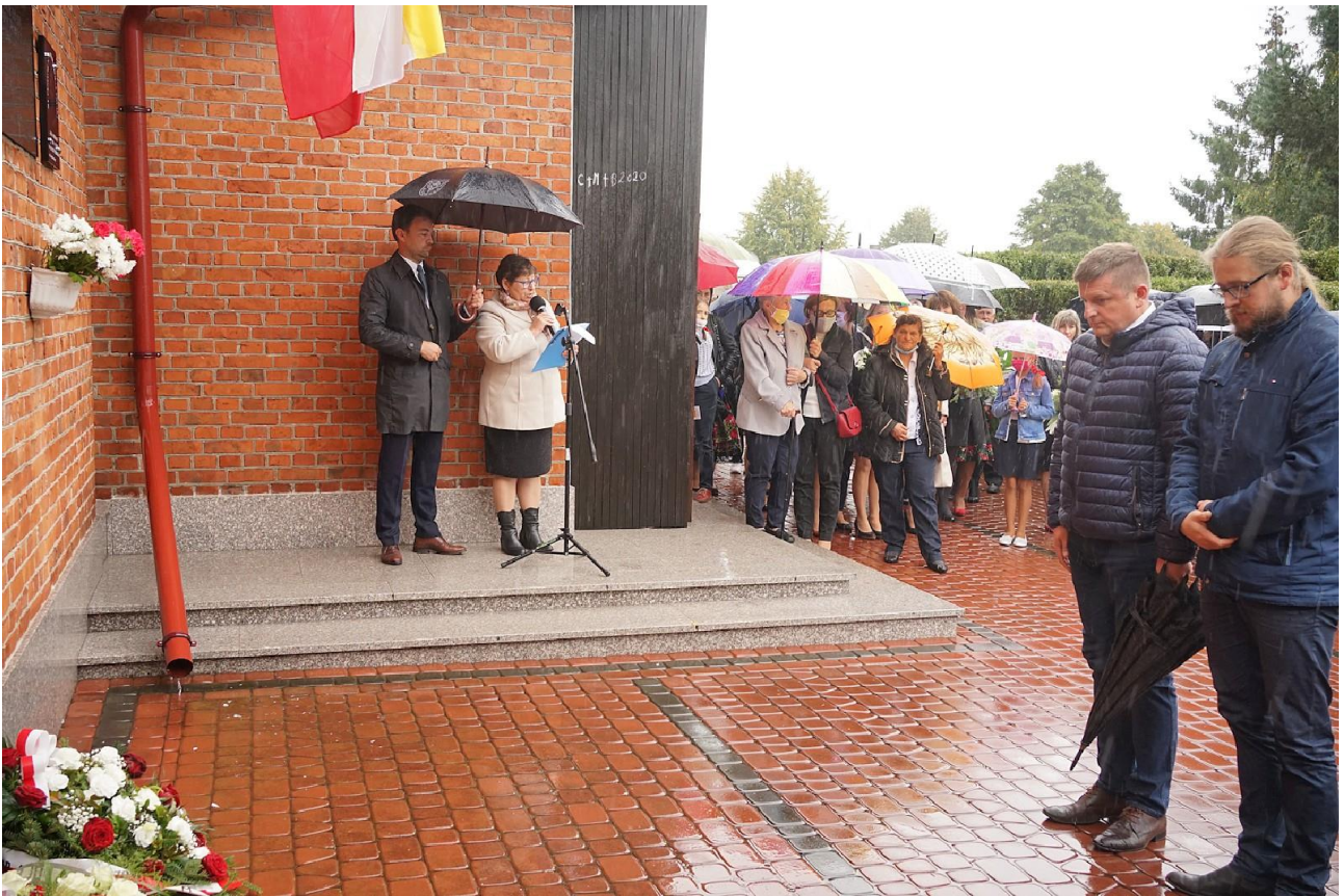
Uroczystości patriotyczne upamiętniające Lotników Ziemi Gniewoszewskiej.