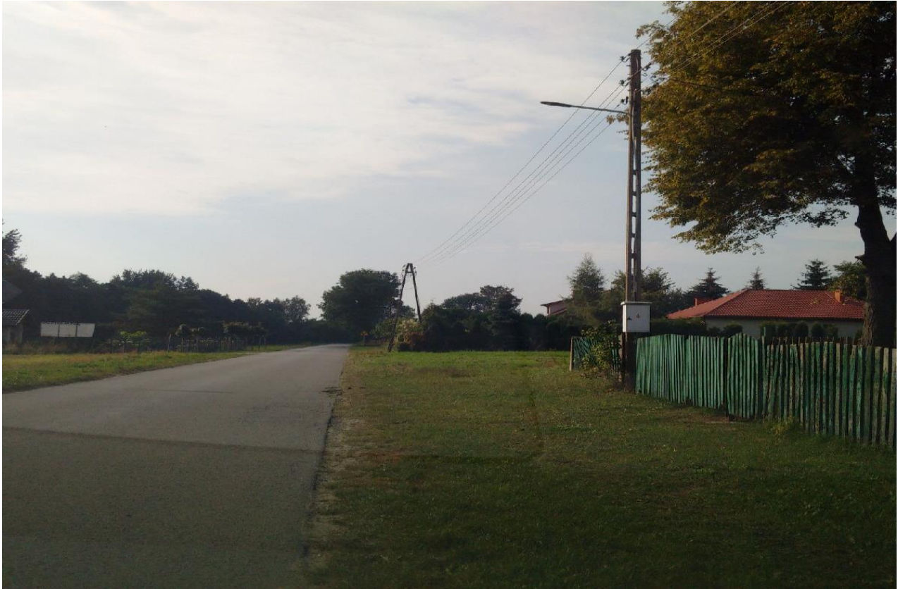
Zadanie „Modernizacja oświetlenia ulicznego w miejscowości Boguszówka”