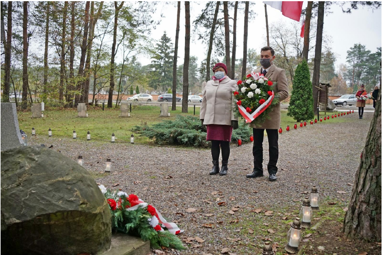
Obchody Narodowego Święta Niepodległości.