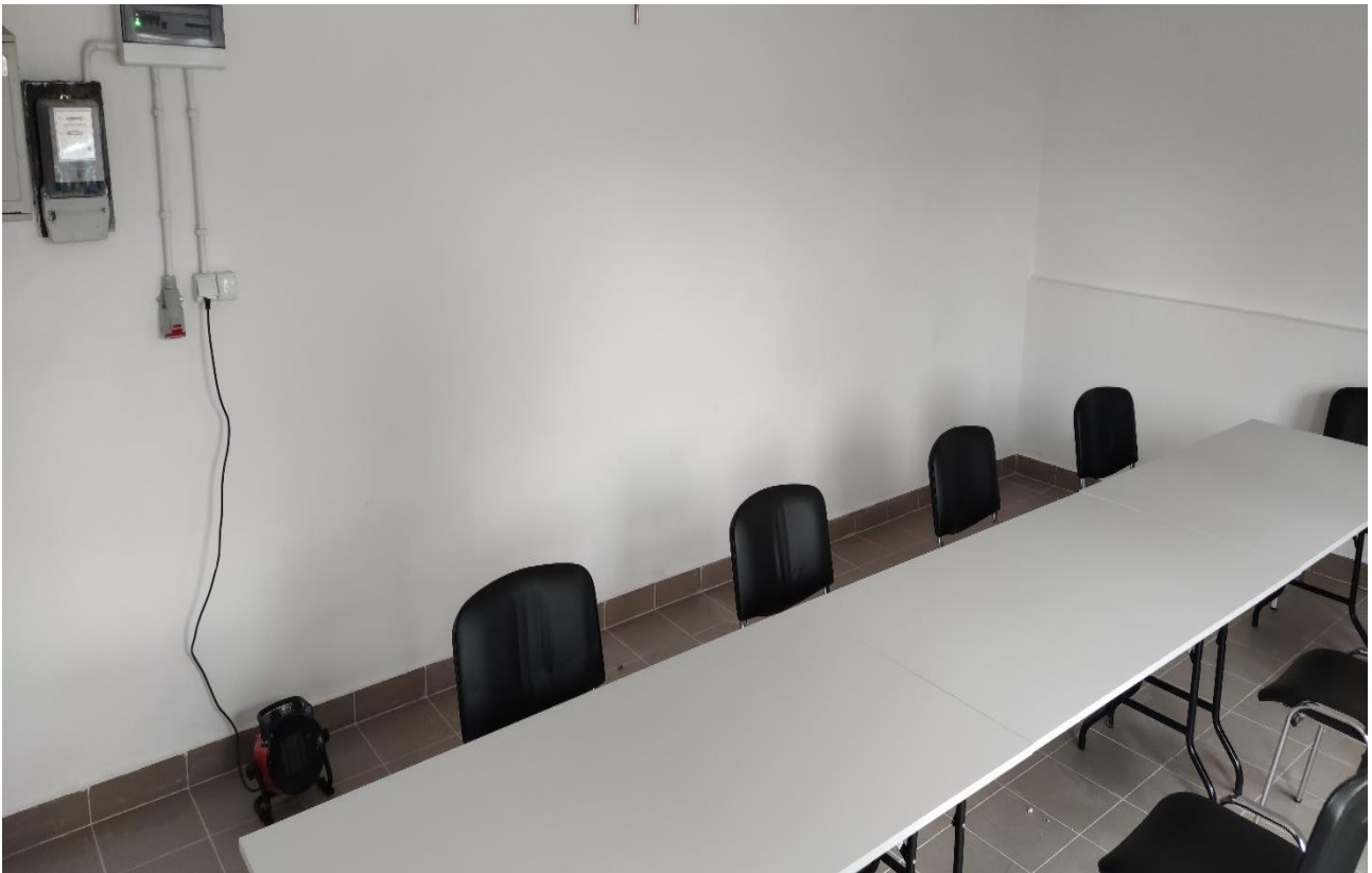
Zadanie „Modernizacja świetlicy wiejskiej w Zdunkowie”