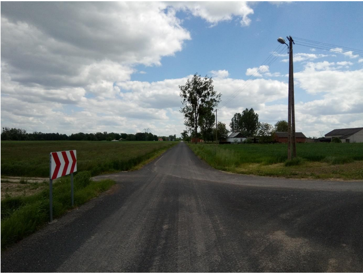
Przebudowa odcinka drogi w m. Sarnów „Nowe Pole”.