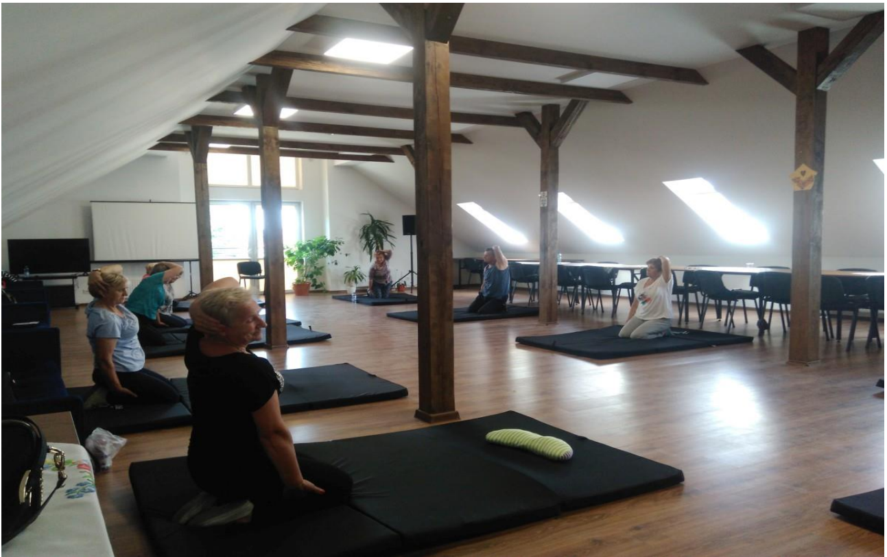
Zajęcia z fizjoterapeutą 17.07.2020 r.